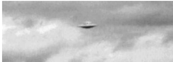
Dieses „UFO“ wurde angeblich 1999 in Mexiko aufgenommen, was jedoch nicht überprüfbar ist.

Im Frühling des Jahres 1998 traf ein bemerkenswerter Brief bei einer Dame ein, die im Zuge der Entwicklungsarbeiten für einen Film zum Thema "UFO" in Lateinamerika recherchiert hatte. Der Brief kam, ohne Absenderadresse, aus Mexiko. Er stammte von einer jungen Dame, die sie rund 15 Jahre zuvor kennengelernt hatte.