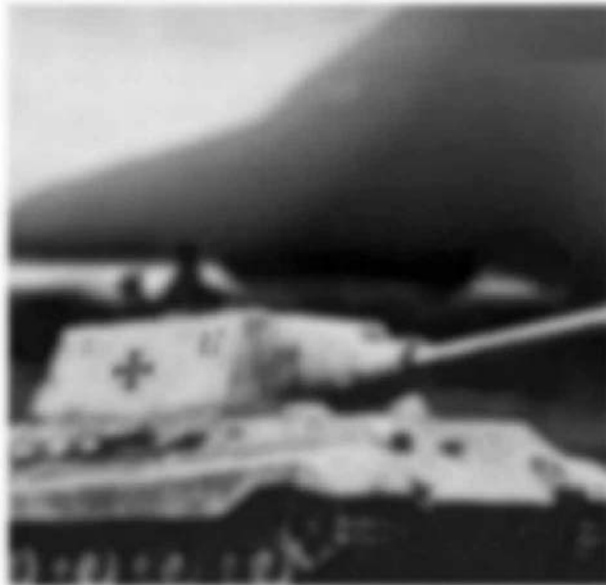
Jagdtiger vor dem gelandeten Haunebu III (?) .

Insofern würde das Ausbleiben massiver deutscher „UFO“-Einsätze sogar dann logisch erscheinen, wenn wir alle anderen Komponenten als gelungen annehmen wollten. Ob es ein fertiggestelltes Gerät Haunebu III wirklich gab, bleibt vorerst eine nicht mit letzter Schlüssigkeit zu beantwortende Frage. Doch darf wohl gesagt werden: Es spricht mehr dafür, als dagegen ins Feld geführt werden kann. Vor zweieinhalb Jahren sind aus zwei verschiedenen, aber verwandtschaftlich miteinander verbundenen, Quellen in Italien erstmals Fotografien aufgetaucht, die die Realität des Haunebu III womöglich dokumentieren. Besonders jene Aufnahme wirkt bemerkenswert, die nur einen Teil des Geräts eingefangen hat, weil vermutlich die Männer auf dem Jagdpanzer (Jagd-Tiger) im Vordergrund fotografiert werden sollten, nicht aber das mit Sicherheit unter