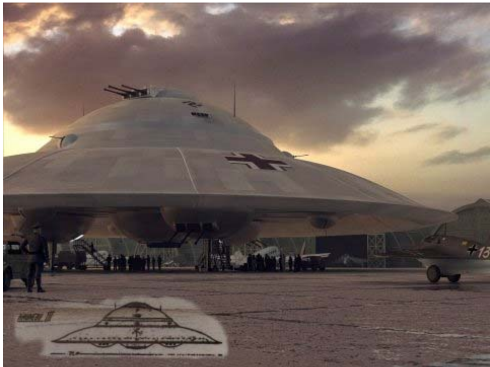
Computerunterstützte Darstellung Haunebu III