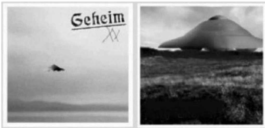
Haunebu III, angeblich im Raum Bodensee, Anfang 1945.

Code "Siegfried-Marta" (für S und M = Stützpunkt Mars) dort eine Basis zu errichten, von der aus mittels der neuartigen Geräte der Krieg hätte weitergeführt werden können, auch wenn Deutschland bereits vollständig vom Feind besetzt war. Es heißt, der Antrieb der Haunebu-Geräte fußte auf demselben Prinzip wie jener der Vril-Geräte, mochte es im Detail der Triebwerke auch Bauunterschiede geben. Über dieses Antriebsprinzip des Fernflugs mittels „Umformung“, werden wir an anderer Stelle noch ausführlich sprechen. Es stellt den Schlüssel zu alledem dar und erscheint keineswegs so unfaßbar, wie dies ohne nähere Kenntnisse aussehen mag. Galt also für die Haunebu-Geräte das Gleiche wie für die Vril-Geräte, so wäre die Überlegung, vom Mars aus zu operieren, keineswegs abwegig gewesen. Die beiden angeblich mit Vril 7 durchgeführten Testflüge bis zum Mars (jedoch ohne Landung) sollen ergeben haben, daß die reine Flugzeit im Welt- all nach der Umformung weniger als zehn Minuten betrug. Wie gesagt, über dieses Fortbewegungsprinzip wird noch ausführlich gesprochen werden; hier begegnen sich auch die Themen „UFO“ und „Makara“ bis zu einem gewissen Grade.